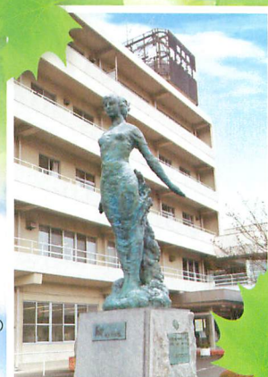
青少年会館の シンボル

落ち着いた雰囲気の中で研修を。 大研修室を始め、8つの研修室が22時まで 使用できます。